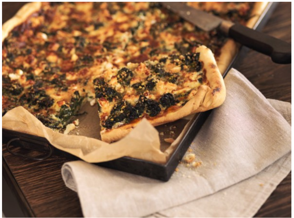
Spinatquiche, made in der apoTHEKE

Eine Apotheke in einen Gastrobetrieb umzuwandeln bedeutet per se einen langen Weg durch die Ämter. Ist das Gebäude im Inventar der Denkmalpflege aufgeführt, wird das Bewilligungsverfahren erst recht zum Marathonlauf. Hier kam den Anfangsdreissigerinnen das Jurastudium und die berufliche Tätigkeit als Anwältin und Wirtschaftsprüferin zugute. Sie nahmen erfolgreich alle Hürden und durften die Räumlichkeiten nach ihren Vorstellungen umbauen. «Wir wollten einen Ort schaffen, der gemütlich ist – eine kleine Oase, in der man gerne verweilt. In der Inneneinrichtung haben wir warme Materialien wie Holz und Stoff mit Elementen des Industrie-Chic gepaart», sagt Nadine Ledermann. Schlussendlich hätten sie dank des Umbaus, den die Umnutzung mit sich brachte, von A bis Z ihre ganz persönliche Ästhetik verwirklichen können.